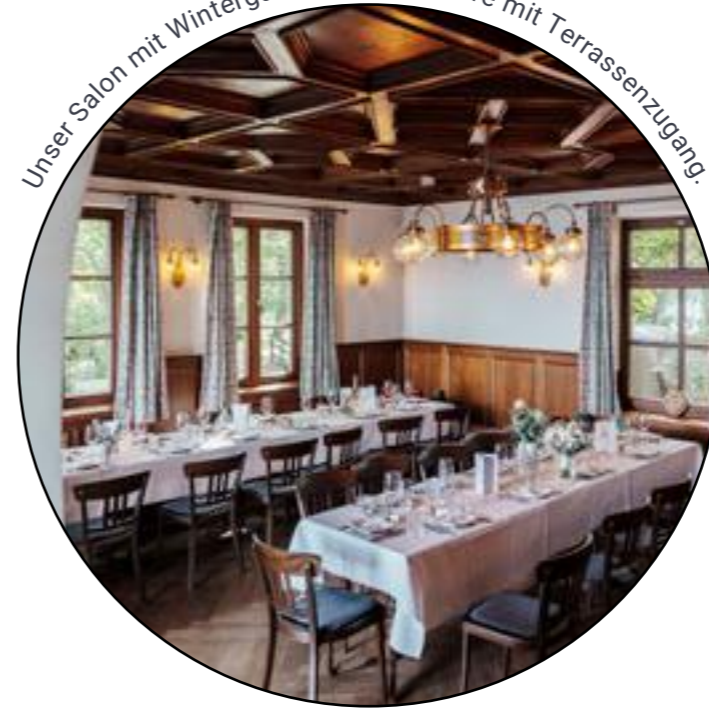
Unser Salon mit Wintergarten. Privatsphäre mit Terrassenzugang.