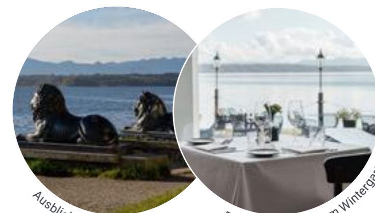
Ausblick auf die Löwen.