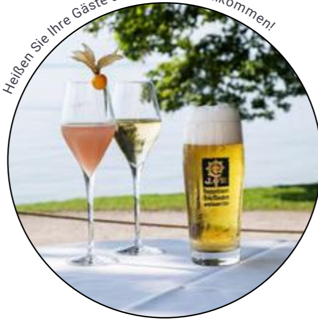
Heißen Sie Ihre Gäste angemessen willkommen!