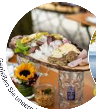
Genießen Sie unsere Schmankerl...

Bleibt nur noch zu sagen: Seh' ma uns am Midgardhaus!