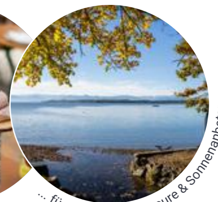
... für alle Radler, Flaneure & Sonnenanbeter.