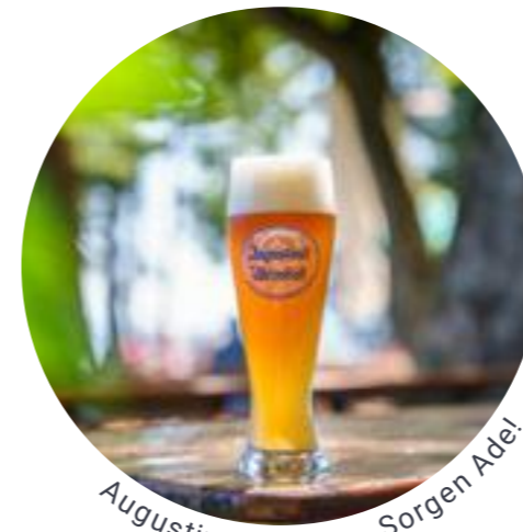
Augustiner am See. Sorgen Ade!