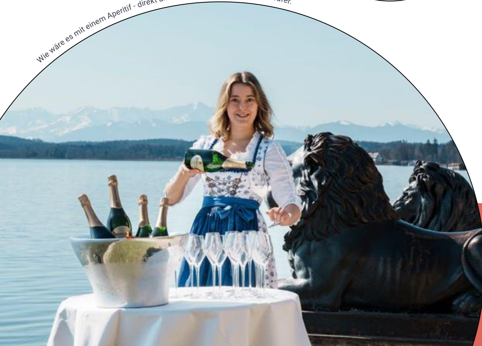
Wie wäre es mit einem Aperitif - direkt an den ikonischen Löwen am Seeufer.