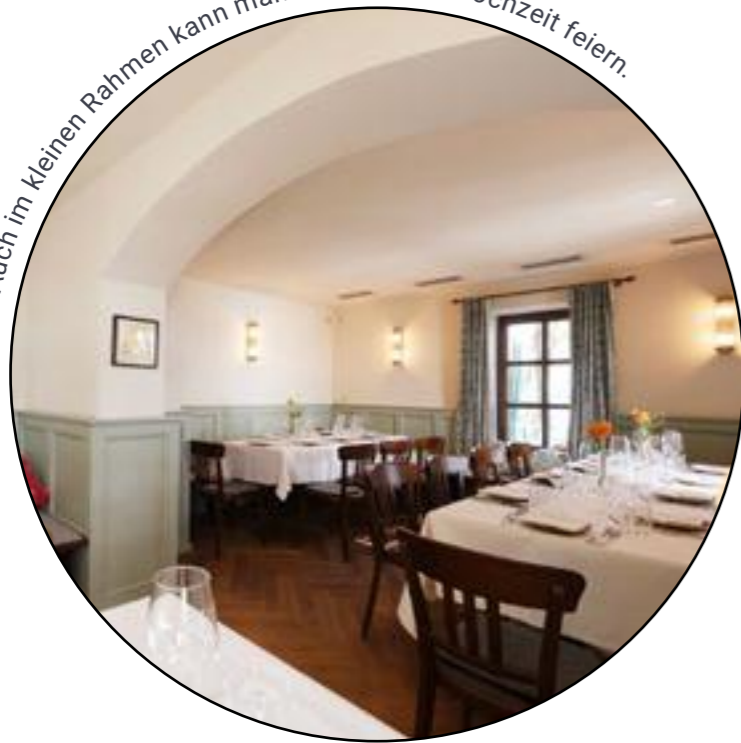
Auch im kleinen Rahmen kann man bei uns eine Hochzeit feiern.